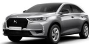
Artense szürke (M0F4) 275 000