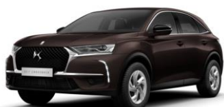
Andradite barna (M0PB) 275 000