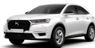
Gyöngyházfehér (M6N9) 320 000