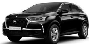
Perla Nera fekete (M09V) 275 000