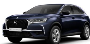
Indigókék (M0KU) 275 000