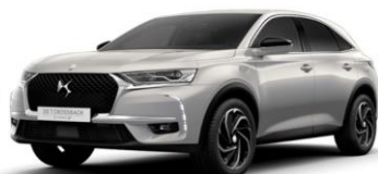
Crystal Pearl szürke (M0PH) 320 000

A Performance line kivétel nem rendelhető a következő színekben: Bizánci arany, Andradite barna, Indigókék