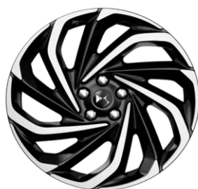
19" LONDON 205/55R19 (Tall & Narrow)