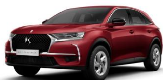
Absolu vörös (M5F3) 320 000