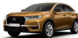
Bizánci arany (M0NZ) 275 000