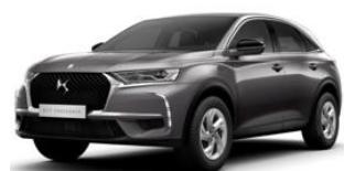
Platinaszürke (M0VL) 275 000