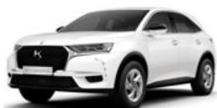
Hófehér (POWP) Az alapár tartalmazza